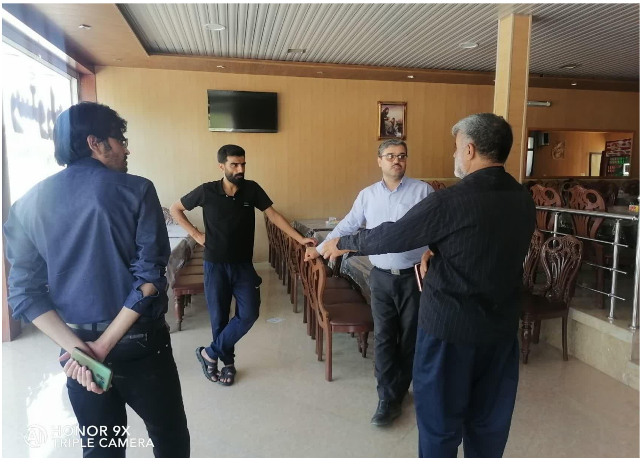
گفتگو با افراد محلی